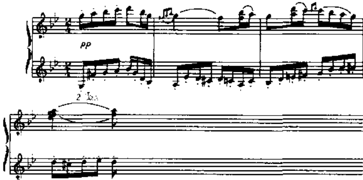
Chacone , op. 75 [O-122], cc. 1-5; 126-129

tratamiento contrapuntístico. Dentro del esquema de la canción doble (A-B-A, C-D-C, A-B-A), la sección D es una elaboración contrapuntística de C, hecha a la manera de un pequeño desarrollo temático de sonata clásica (ver ej. 18). Este Menuet (O-137) encontró una buena acogida en Francia, según lo demuestra la transcripción para violín y piano que hizo p. Henri Leclerc (O-140), publicada en 1889 como el N° 6 de la “Ecole de Style et d’Accompagnement/Collection d’Oeuvres Anciennes et Modernes Transcrites pour Violon et Piano”. Leclerc era “Directeur de l’Ecole Municipale de Musique de Troyes”, y para su versión transporta la tonalidad original de La mayor a Sol mayor, a fin de adecuarla mejor al violín. En la Marche Turque (O-135), Guzmán aprovecha íntegra una sección de la polka brillante basada en materiales de Heroe á Força (O-88) en una de las secciones centrales de la marcha.