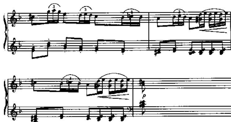
Bolero , op. 81 [O-133], cc. 1-12

obra homónima compuesta y editada en Río de Janeiro (O-82), según ya se ha indicado. En el tercer grupo Guzmán perfecciona el cultivo de especies ya abordadas en sus etapas anteriores, como son la 6 a Mazurka , op. 73, N o 1 (O-126, 1886), la 7 a Mazurka , op. 73, N o 2 (O-127, 1886), la Mazurka , op. 79 (O-131, 1886), la Mazurka en Ré mineur (8 a Mazurka ), op. 82 (O-134, 1886), el Nocturne , op. 72 (O-125, 1886), y la 2 a Polonaise , op. 80 (O-132, 1886).